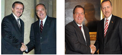
Şekil 3. Sol Taraf: Erdoğan-Chirac, Sağ Taraf: Schröder-Erdoğan

Deneylerde internet üzerinden oluşturulmuş 30'ar adet yüz fotoğrafından oluşan 9 tane alıştırma grubu kullanılmıştır. Bu grupları oluştururken [3]'de anlatılan veri kümelerinden yararlandık. Bu sebeple yeterince alıştırma grubu oluşturmuş olduk. Bu grupların isimlerini elle verdiğimizden, bu isimleri doğru bildiğimizi varsayıp, deneyimizi bu gruplar üzerinden genişleterek sürdürdük. Daha sonra veri kümemize sonuçlarımızı test etmek üzere, içlerinde bu gruplardan kişilerin ve bilinmeyen kişilerin olduğu ikili 40 tane fotoğraf ekledik. Bu test gruplarında internet üzerinden ikili ilişkilerin olduğu fotoğraflardan yararlandık. Bu yolla oluşturduğumuz veri kümelerinde işlemlerimizi sürdürdük (Bakınız Şekil 3). Fakat, bu yolla oluşturulan büyük veri kümeleri biraz zaman alacağından şimdilik sınırlı bir test kümesinde işlemlerimizi yaptık.