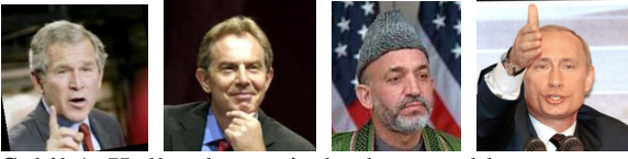
Şekil 1. Kullanılan resimlerden örnekler

belirtilen sebeplerden dolayı yüz tanıma problemi daha zor bir hale gelmektedir.